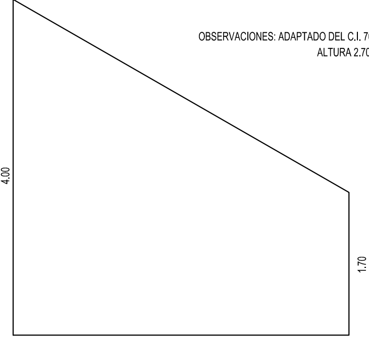
DIMENSIONES DE LA ALETA (VER PLANO CI-972 ARMADURA)

OBSERVACIONES: ADAPTADO DEL C.I. 706 ALTURA 2.70m